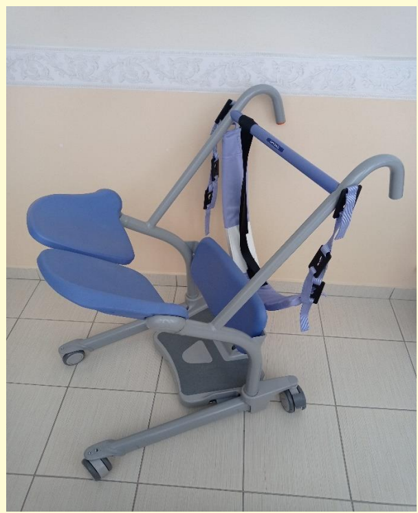
podlahové zdvíhacie zariadenie