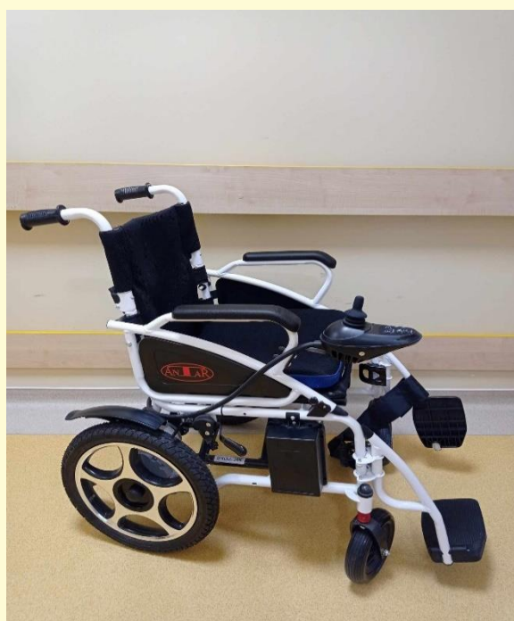
elektrický invalidný vozík