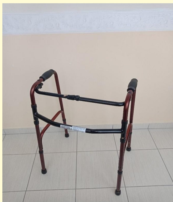
štvorbodové chodítko skladacie