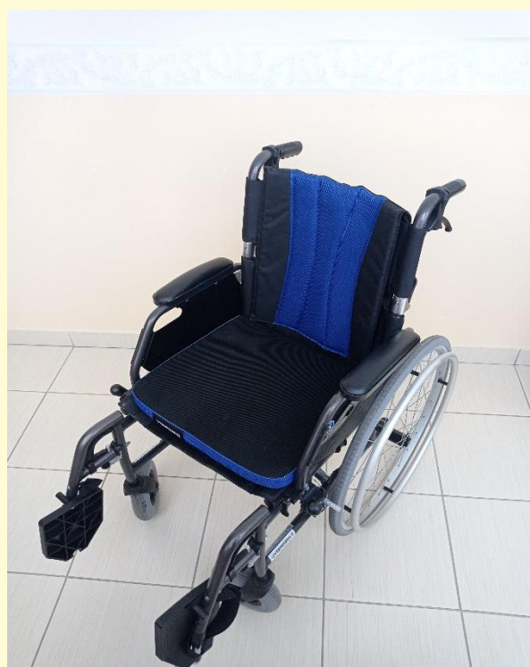
invalidný vozík odľahčený