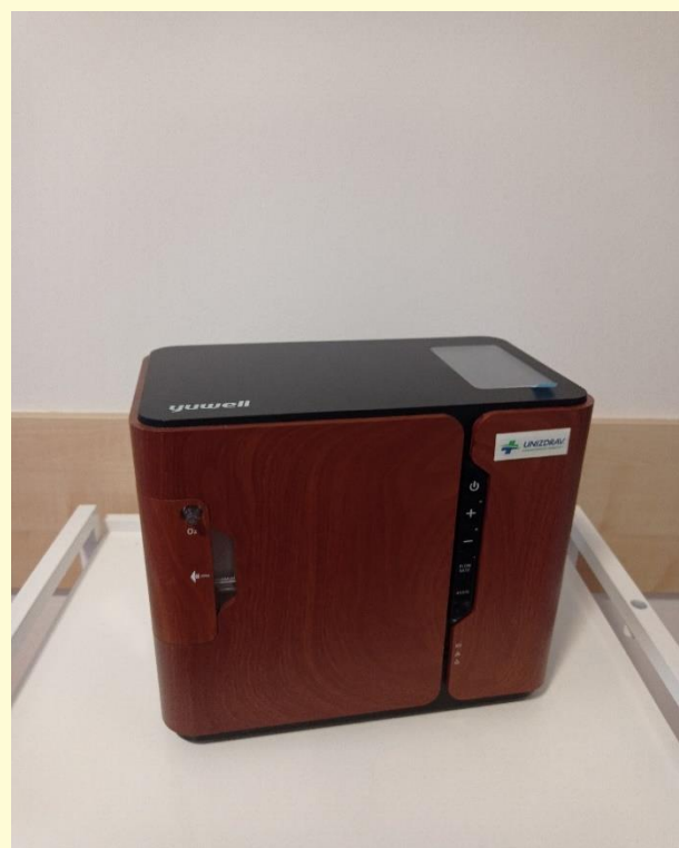
kyslíkový koncentrátor na domáce použitie

Inkontinenčné pomôcky zabezpečujeme poukazmi na jednotlivých prijímateľov. V prípade zvýšenej potreby používania inkontinenčných pomôcok (plienky, vložky a pod.), spolupracujeme s príbuznými a blízkymi prijímateľov.