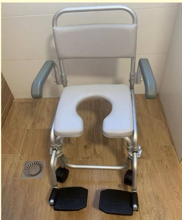
toaletný sprchový vozík

Pre potreby výkonu opatrovateľsko-ošetrovateľských úkonov, zariadenie disponuje so špeciálnymi zdravotníckymi pomôckami: