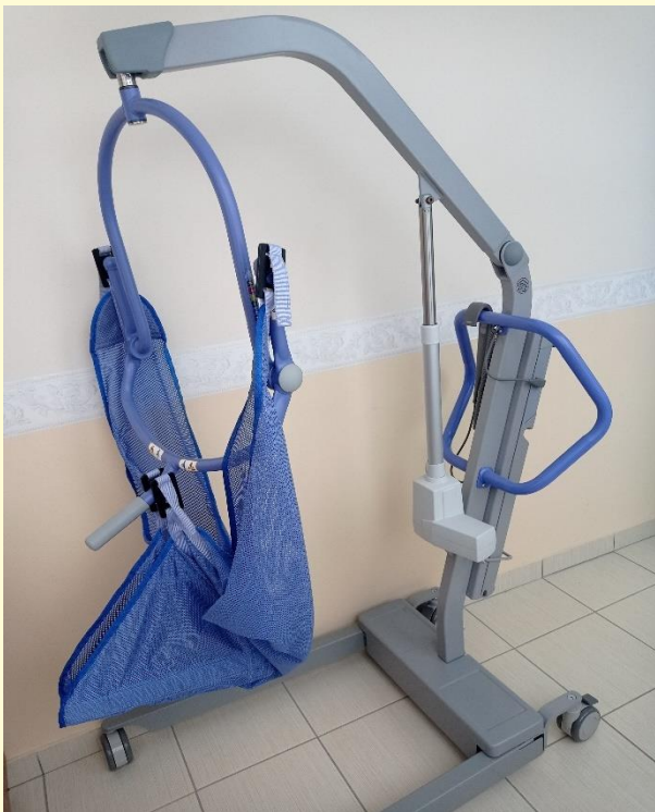
mobilný elektrický zdvihák