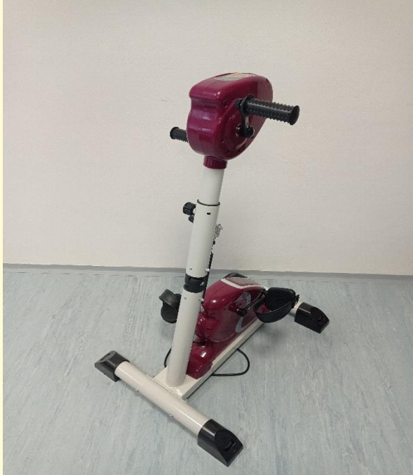
elektrický rehabilitačný bicykel