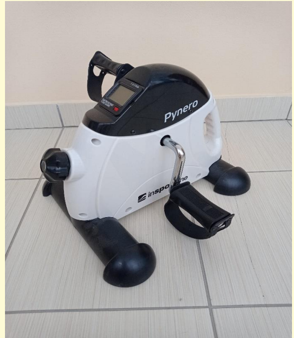
prenosný rotoped pre ruky/nohy