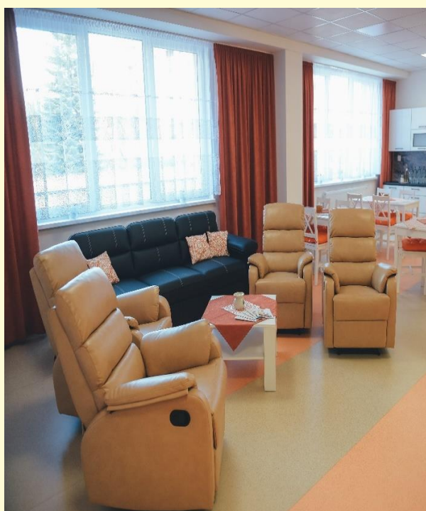
relaxačné polohovacie kreslá