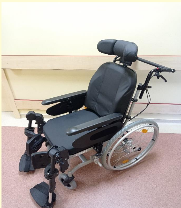
vozík invalidný mechanický